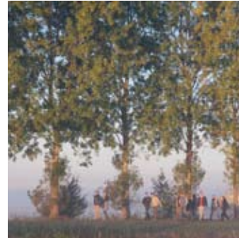
Arta ambulans polikliniek en deeltijdbehandeling