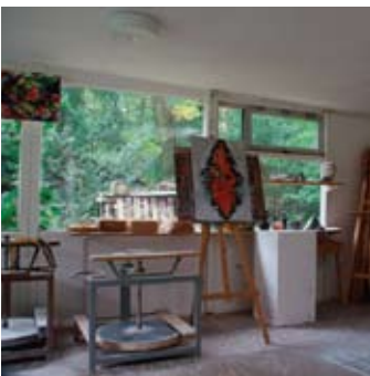
Arta nazorg Meppel