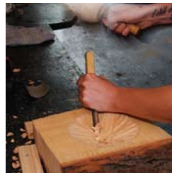
Arta nazorg en maatschappelijk herstel Arta RIBW kleinschalig wonen